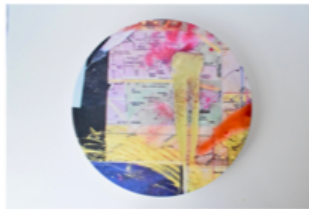
【プラター】 ストーンマックス合成樹脂/直径27.5cm