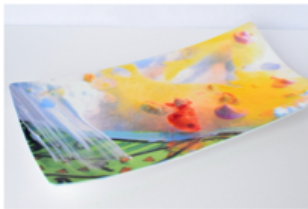
【長皿】 ホワイトクレイ製/35.5 × 17 × 4cm