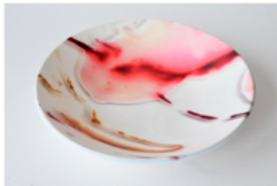
【楕】 ストーンマックス合成樹脂/20.5 × 3cm